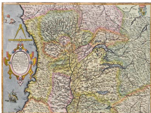
1. Ducatus Mediolanensis [...], 1570-1612, acquaforte. Milano, Civica Raccolta delle Stampe "Achille Bertarelli"