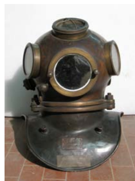
12. Elmo di palombaro, XX secolo. Milano, Raccolte Storiche del Comune di Milano - Civico Museo Navale Didattico