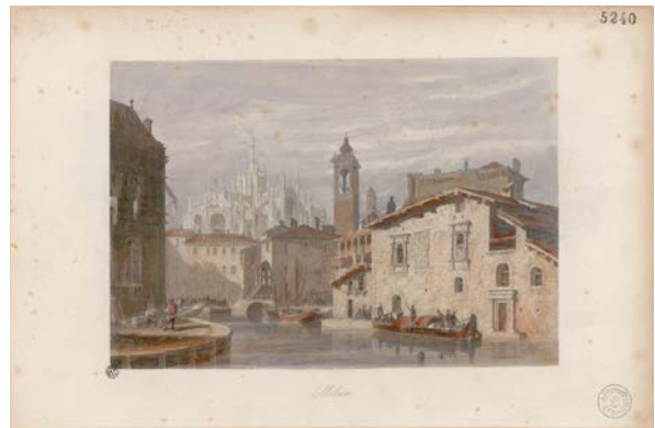
5. Milano, laghetto dell'Ospedale , circa 1840, acquaforte. Milano, Civica Raccolta delle Stampe "Achille Bertarelli"