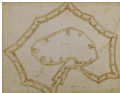
3. Pianta delle fortificazioni milanesi della metà del XVI secolo, metà del XVI secolo, inchiostro e acquerello. Milano, Civica Raccolta delle Stampe "Achille Bertarelli"