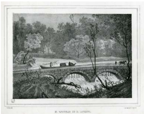
4. Giuseppe Elena, Francesco Guarisco, Milano, Naviglio e Lambro , 1836, litografia. Milano, Civica Raccolta delle Stampe "Achille Bertarelli"