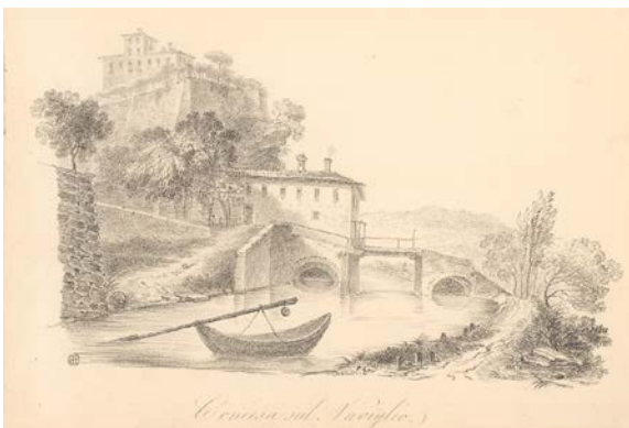
6. Concesa sul Naviglio , circa 1840, litografia. Milano, Civica Raccolta delle Stampe "Achille Bertarelli"