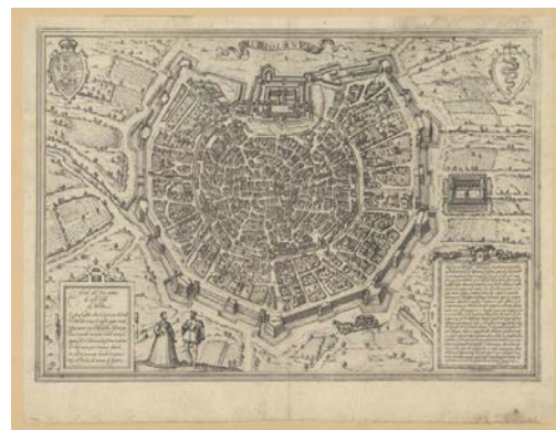
7. Franz Hogenberg, Mediolanum , 1572, acquaforte. Milano, Civica Raccolta delle Stampe "Achille Bertarelli"