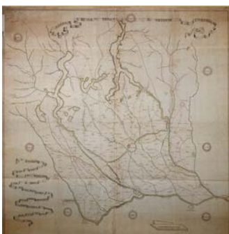
8. Distretto del Ducato di Milano con parte delle sue Prov[inc]e Conf[ina]men[ti] e vedesi in disegno in quest[ta] carta il territorio e fiumi principali con tutte le città , 1741, inchiostro e acquerello su carta. Milano, Civica Raccolta delle Stampe "Achille Bertarelli"